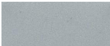
Prata Fosco Metálico