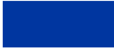
Azul Royal Brilho