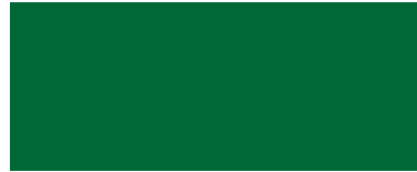
Verde Bandeira Fosco